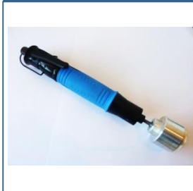
Details handsluit, SMHS