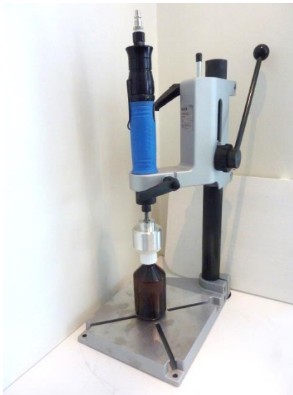
Tafel doppensluit, Type RGHS