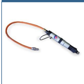
Details handsluiters RGHS