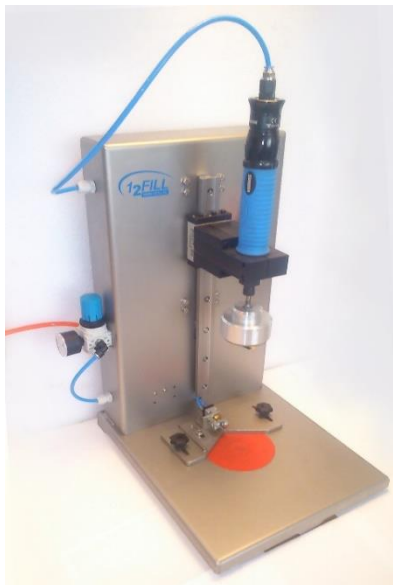
Tafel doppensluitser, Type DS-TT-JHPN-AS